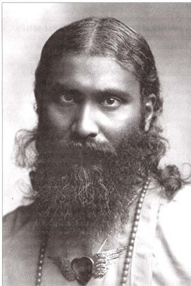
Хазрат Инайят Хан